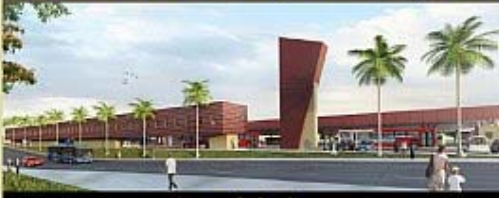
Estação São José