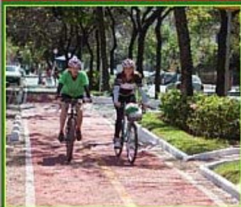
Ciclovia Savassi: Rota possui 2,8 km de extensão e liga a Região da Savassi à Região Hospitalar.