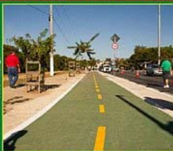
Ciclovia da Av. Risoleta Neves (Via 240): Rota possui 2,2 km de extensão e liga a Ciclovia da Av. Saramenha (Região Norte) à Estação BHBUS São Gabriel.