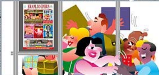
ILUSTRAÇÃO: Es. Auto Rodrigues

AO EMBARCAR, OCUPAR O SALÃO TRASEIRO DO ÔNIBUS