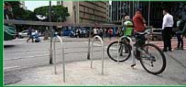
Paracielos da Praça Sete