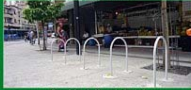
Paracielos do Mercado Central

A BHTRANS implantou 52 paracielos nas Regiões da Savassi, Noroeste, Barreiro, Nordeste, Central e Leste. Projeto cria 104 vagas de estacionamento para bicicletas na capital e faz parte do Programa Pedala BH.