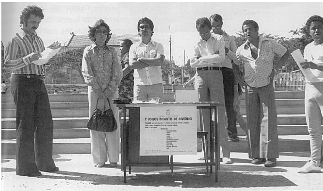
1º Jogos Infantis de Inverno do Centro Comunitário Praça de Esportes Saudade (CCPES).